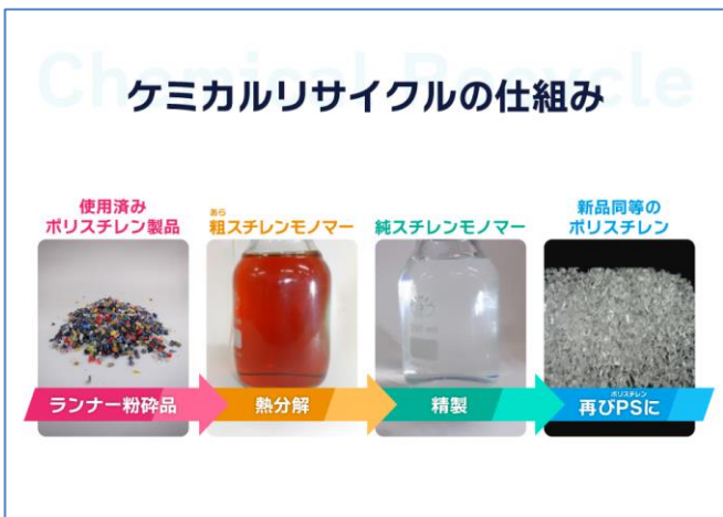
プラモデルのケミカルリサイクル イメージ

BANDAI SPIRITS と P S ジャパンは使用済ランナーを活用したプラモデルのケミカルリサイクルの研究を 2021 年から続け、この度初めてケミカルリサイクル原料を使用したプラモデル量産品の実用化に至りました。今後の本格的な活用に向けての第一歩となります。BANDAI SPIRITS と P S ジャパンは、循環型社会の実現を目指し、持続可能なものづくりの推進に積極的に取り組んでまいります。