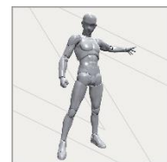
▲S.H.Figuarts 「ボディくん (Gray Color Ver.)」