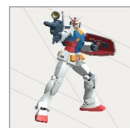
▲ROBOT 魂 ver. A.N.I.M.E 「ガンダム」