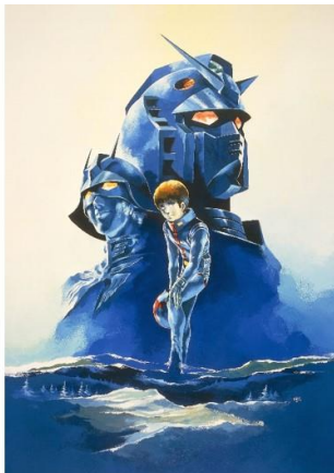
『機動戦士ガンダムII 哀・戦士編』