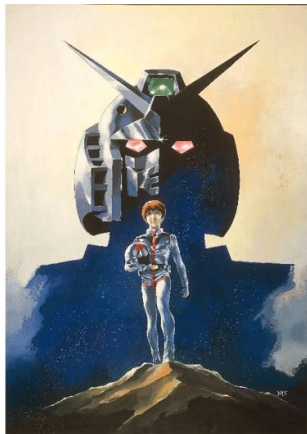
劇場版『機動戦士ガンダム』

アラブ首長国連邦にて、ガンダムアニメーションの YouTube 配信として、劇場版『機動戦士ガンダム』、『機動戦士ガンダム II 哀・戦士編』、『機動戦士ガンダム III めぐりあい宇宙編』の全三部作を、2021年10月1日～12月31日の期間限定で、公式ガンダム情報ポータルサイト「GUNDAM.INFO」YouTube チャンネル(URL: https://www.youtube.com/user/gundaminfo )にて配信します。配信は英語字幕です。