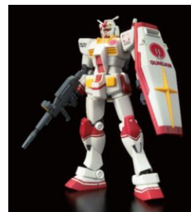
日本館 PR アンバサダー仕様のガンプラ