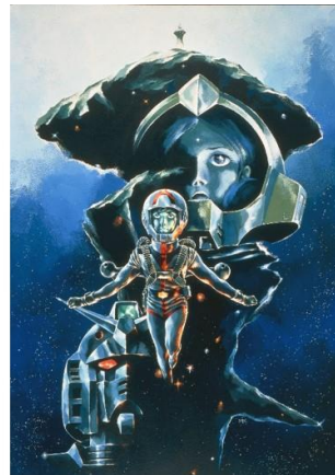
『機動戦士ガンダムIII めぐりあい宇宙編』

※本プレスリリースの内容は2021年10月18日現在のものであり、予告なく変更する場合があります。