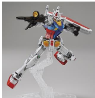
商品オリジナルのライフル、シールドが付属