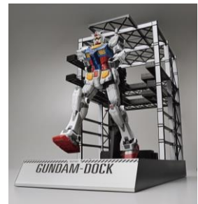
同スケールのガンダムドックが付属 ※ガンダムドックの形状、可動は実際のガンダムドックとは一部異なります