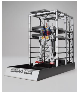
1/144 RX-78F00 ガンダム &ガンダムドック