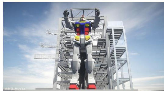
ポージングイメージ