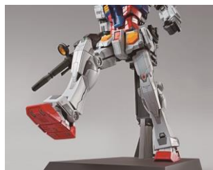
歩行、右腕上げ、両腕上げなどの可動を再現