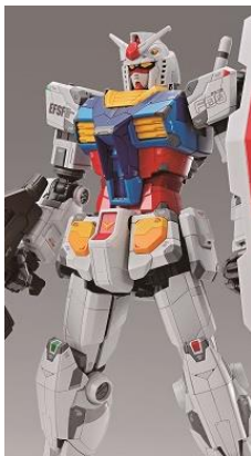
動くガンダム立像「RX-78F00」のディテール、カラーリングをホイルシール、マーキングシールで再現

動く実物大ガンダムのカラーリング、可動を 1/100 スケールで再現したガンプラです。