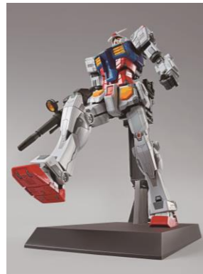
1/100 RX-78F00 ガンダム