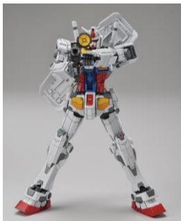
歩行、右腕上げ、両腕上げなどの可動を再現

動く実物大ガンダムのガンダムドック、可動を 1/144 スケールで再現したガンプラです。