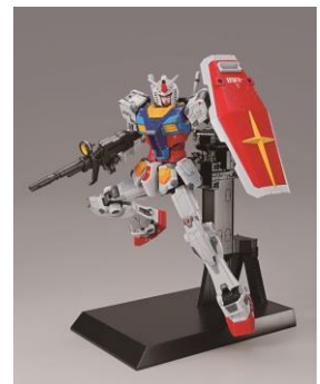
商品オリジナルの専用台座、ライフル、シールドが付属